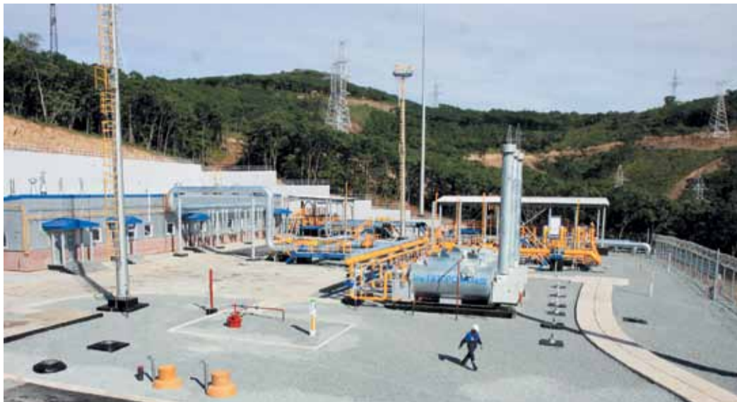
Газораспределительная станция г. Владивостока

— Я участвовал в строительстве станции — это было давно. С тех пор многое изменилось. Раньше все было направлено на технологии, на машины, на технику. Сейчас Газпром повернулся лицом к людям. Главным стали условия труда, комфорт на рабочем месте, посмотрите, какие шикарные кабинеты на нашей компрессорной станции! О таких десять лет назад мы и мечтать не могли!