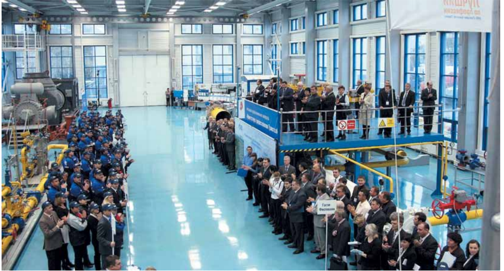
В день открытия – парад участников фестиваля

Конечно, и до этого на одном из самых стабильных предприятий Сибири регулярно проводились всевозможные конкурсы профессионального мастерства. Только за последние шесть лет в учебном центре газовиков было проведено более пятидесяти конкурсов, в которых приняло участие более тысячи человек – представителей всех филиалов ООО «Газпром трансгаз Томск». Но всё это были разрозненные мероприятия, и даже объединяя представителей многих регионов, в которых «Газпром трансгаз Томск» осуществляет свою деятельность, они зачастую носили оттенок локального, местечкового характера. Фестиваль этим как раз и отличается: впервые в рамках конкурсной программы собрались представители сразу шести ведущих рабочих профессий – «Линейный трубопроводчик», «Монтер по защите подземных трубопроводов от коррозии», «Электромонтер стационарного оборудования телефонной связи», «Стропальщик», «Наполнитель баллонов», «Водитель пожарного автомобиля».