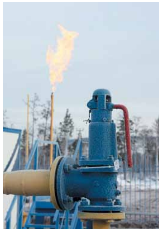
Зимой важен каждый технологический узел