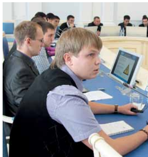
Сегодня студенты, завтра – полноправные газовики

В компании «Газпром трансгаз Томск» прошла защита отчетов по производственным практикам студентов национального исследовательского Томского политехнического университета.