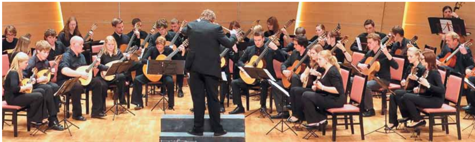
«ГитАрт» открыл новосибирцам новые грани театрального искусства