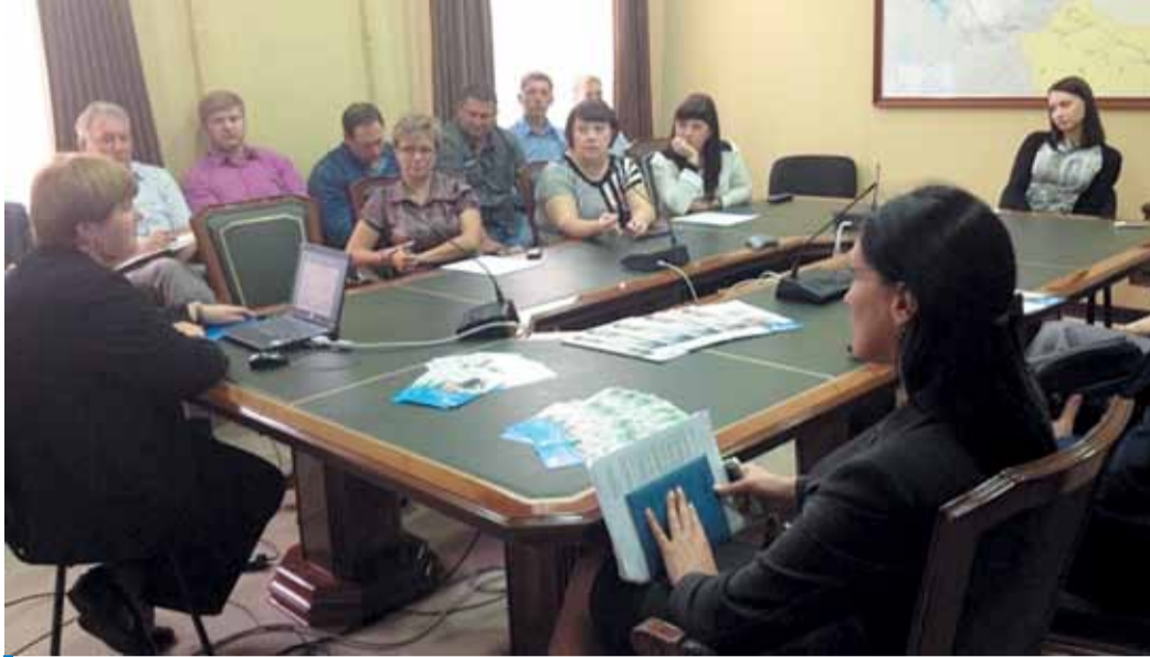
На встрече с представителем НПФ «Газфонд»

В Хабаровске состоялась встреча сотрудников ООО «Газпром инвест Восток» с представителем негосударственного пенсионного фонда «ГАЗФОНД», который рассказал о преимуществах вступления в этот негосударственный пенсионный фонд.