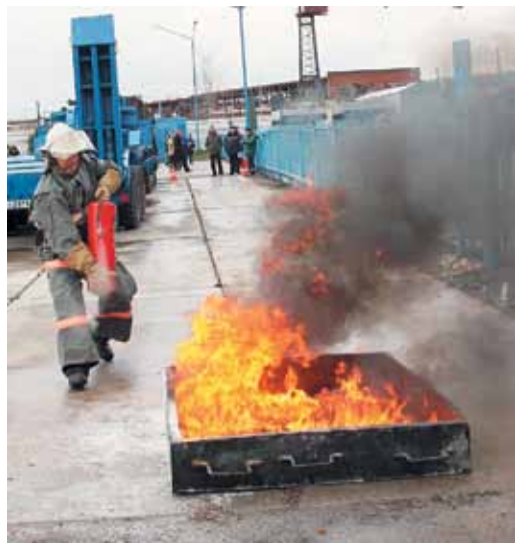
Водитель пожарной машины должен суметь локализовать огонь и потушить его