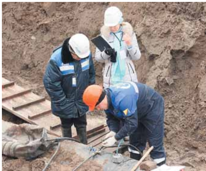
Задания у линейных трубопроводчиков максимально приближены к реальной работе на трассе