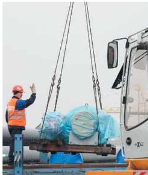
Внимательность и последовательность – слагаемые успеха в работе стропальщика

грузозахватных приспособлений – всё то, что и включает в себя погрузка и разгрузка любого оборудования.