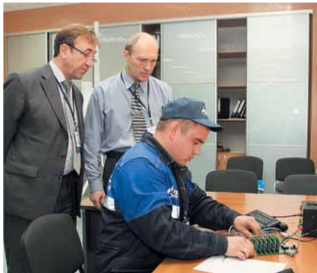
Главные критерии в работе электромонтера стационарного оборудования – качество работ и скорость их выполнения