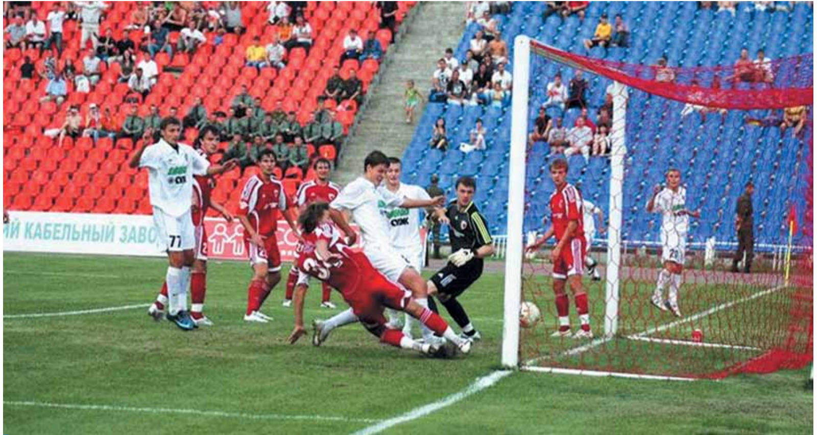
Хабаровские футболисты метят в премьер-лигу

Но без влиятельных спонсоров решать серьезные задачи едва ли под силу. Одним из главных помощников футболистов является компания «Газпром инвест Восток».