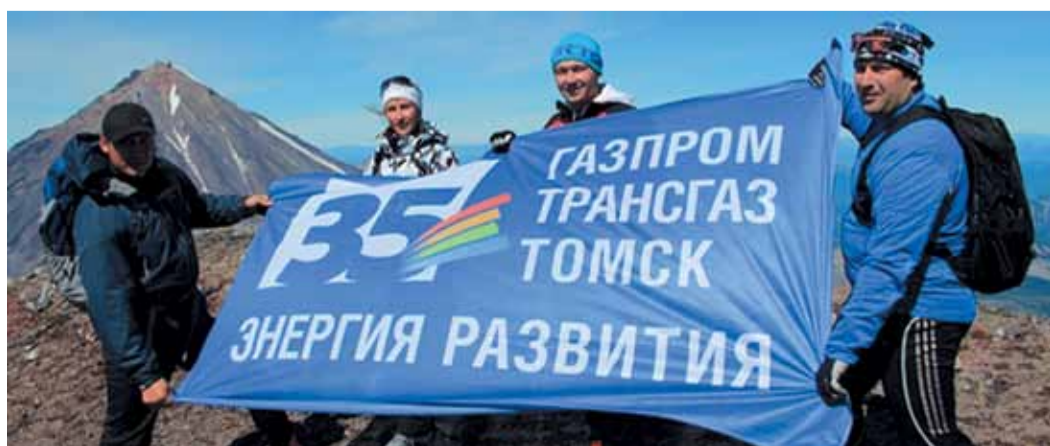
Восхождение на Авачинский вулкан, посвященное 35-летию «Газпром трансгаз Томск»

— В ближайшей перспективе — создание новых филиалов, строительство большого количества новых объектов как производственного, так и социального назначения. Параллельно этому мы, разумеется, будем выполнять нашу основную миссию — заниматься эксплуатацией газотранспортной системы Сибири и Дальнего Востока. Время новых задач и проектов уже стучится в дверь. На повестке дня Якутия. Это направление уже поручено компании. В Якутии предстоит работа с чистого листа — будем строить и эксплуатировать сами. Компания создает все условия для того, чтобы ее завтрашний день был насыщен проектами, реализацией которых занимались бы самодостаточные, грамотные и уверенные в себе люди. У нас замечательная молодежь, которая не мыслит своего будущего без компании, а это уже залог того, что у «Газпром трансгаз Томск» впереди много непокоренных вершин. Чтобы их покорить, желаю всем больше амбициозности, больше дерзости и стремления к новому. Только тот человек — и возраст здесь не имеет никакого значения — почувствует себя счастливым и исполнившим долг, в котором каждую минуту будет бодрствовать создатель. И 35-летняя история нашей компании тому яркое подтверждение. ■