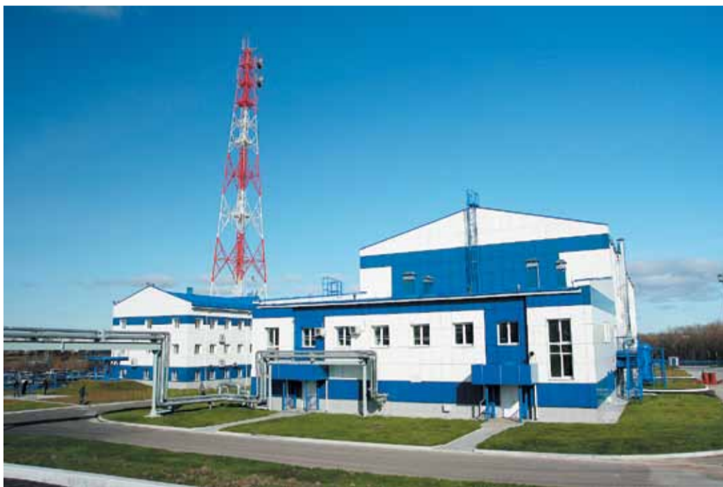
Общий вид объектов Хабаровского ЛПУМГ

Теперь, когда первый пусковой комплекс ГТС «Сахалин — Хабаровск — Владивосток» построен, компания «Газпром трансгаз Томск» приступила к его эксплуатации. В пригороде Хабаровска располагается одно из самых крупных линейно-производственных управлений (ЛПУМГ) этой компании на Востоке России, сотрудники которого будут заниматься эксплуатацией части газотранспортной системы.