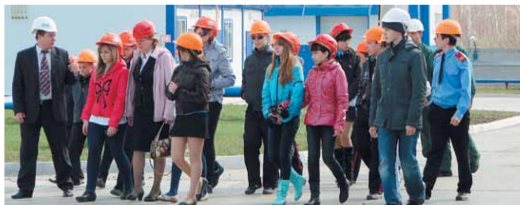
Газовики свято чтут и щедро передают молодежи свои традиции

Корпоративный Год культуры в Барабинском управлении — это не просто слова, а самое настоящее руководство к действию, заключенное