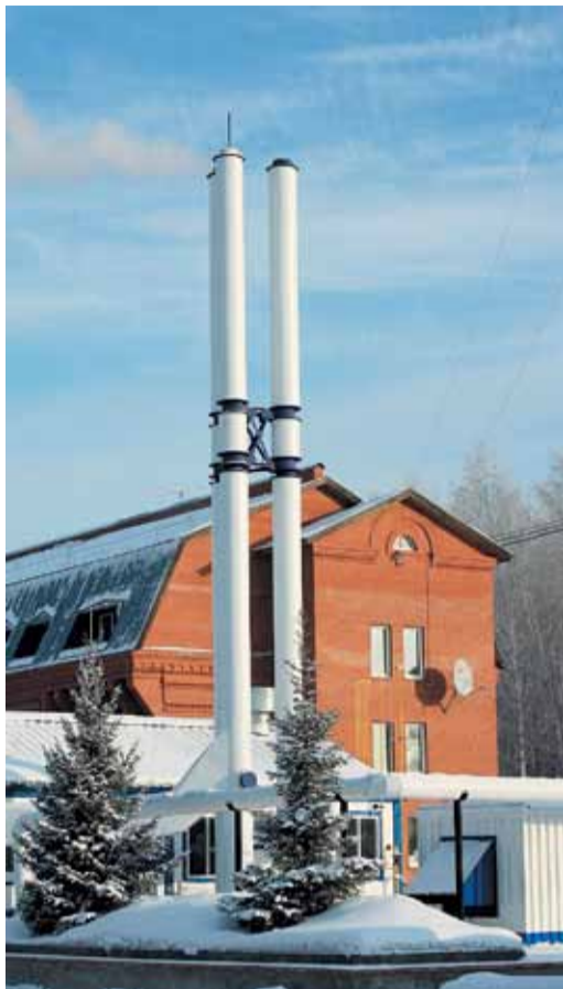
От готовности котельных зависит тепло на объектах

Повышенное внимание специалистами Камчатского ЛПУ уделялось объектам, распо-