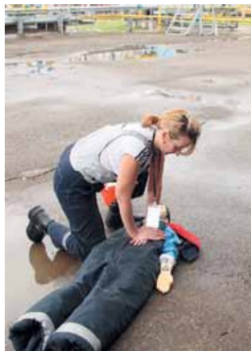
Оказание первой медицинской помощи – в арсенале навыков наполнителя баллонов