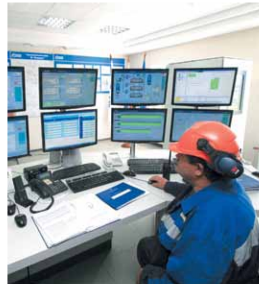
Диспетчерская компрессорной станции «Володино»