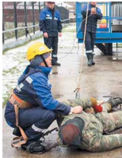
Спассти человека, попавшего под высокое напряжение, – одно из заданий для монтажников по защите трубопроводов от коррозии